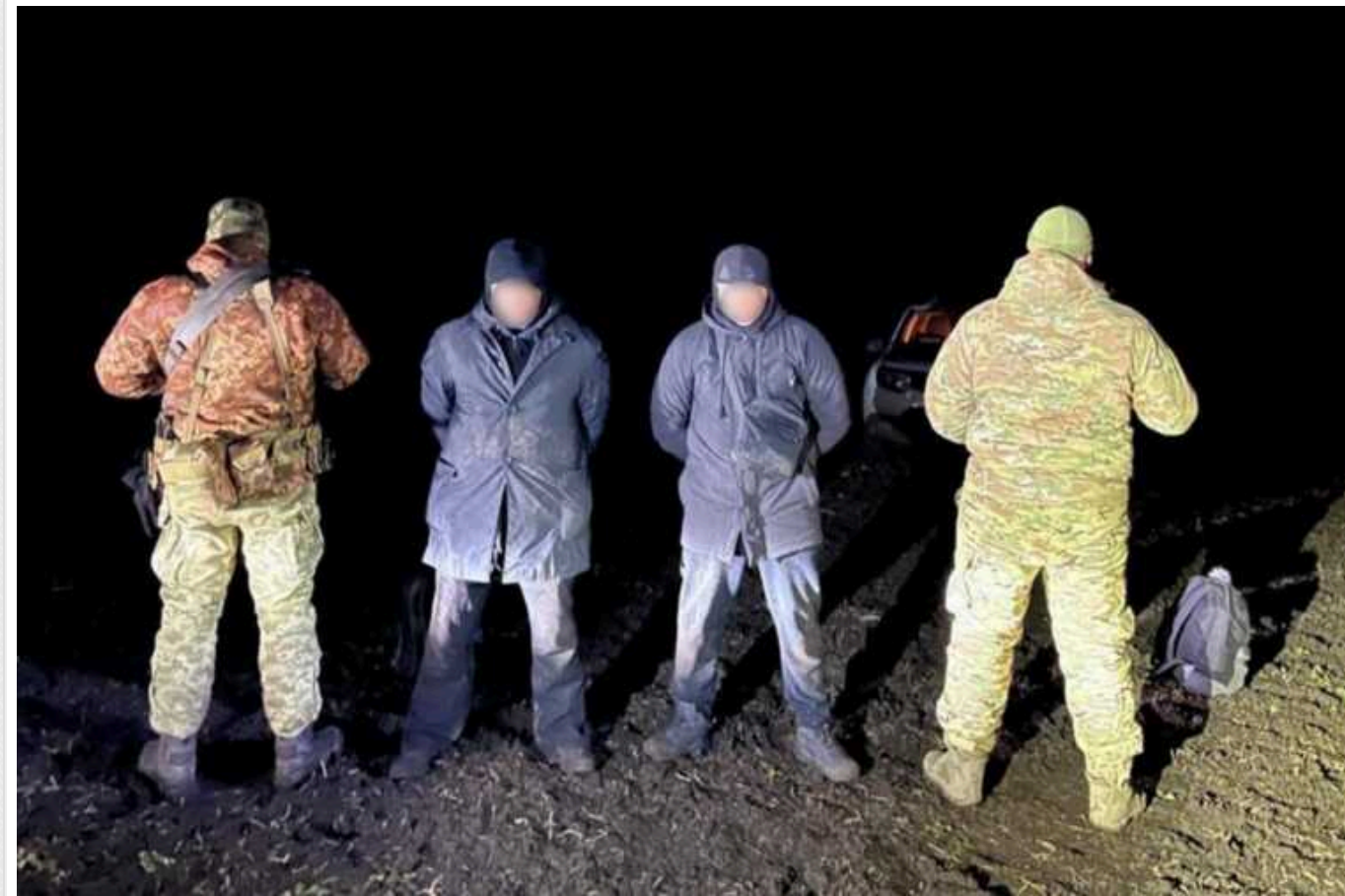
Українські прикордонники затримали порушників-рецидивістів біля кордону з Молдовою

Українські прикордонники повідомили, що в районі кордону з Молдовою затримали порушників-рецидивістів. Один із затриманих намагався незаконно виїхати з України вчетверте за місяць.