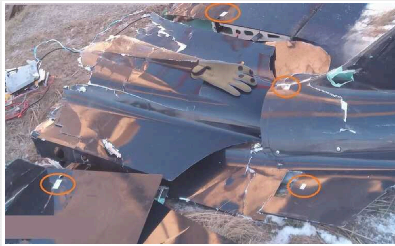
Окупанти шоковані новим "українським" БПЛА: стверджують про "нетипову якість"