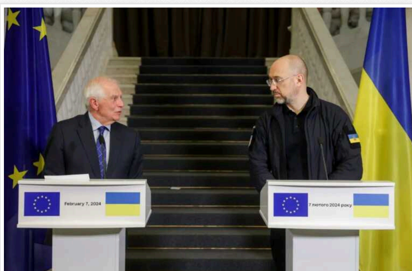
До кінця 2024 року ми розраховуємо надати Україні 1,155 млн боєприпасів, - Боррель

Країни Європейського Союзу мають поставити Силам оборони України 1,155 мільйона боєприпасів до кінця 2024 року. Спочатку в ЄС обіцяли нашій державі 1 мільйон артилерійських снарядів до березня 2024-го.