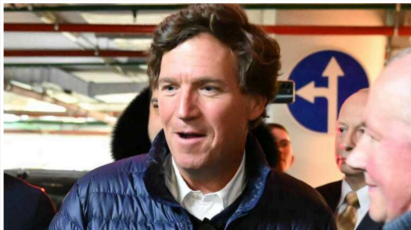
Такер Карлсон уже виконує вказівки Кремля, - CNN

Колишній ведучий американського телеканалу Fox News, пропагандист "руської міра" Такер Карлсон, який анонував інтерв'ю з президентом РФ Володимиром Путіним, вже виконує накази російського авторитарного режиму. Він звинуватив західну пресу в тому, що її представники нібито не намагаються поговорити з диктатором, хоча Кремль насправді відмовляв іншим журналістам.