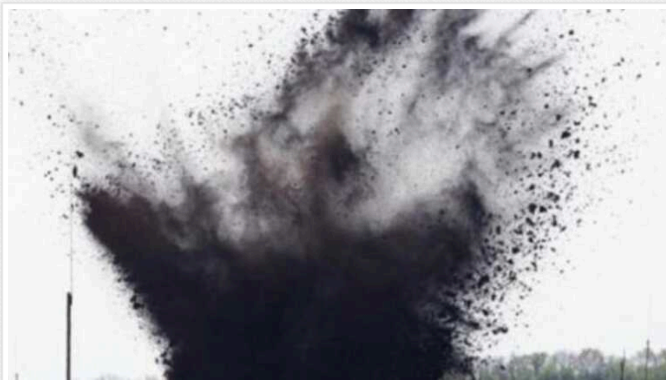
На окупованій Луганщині пролунав сильний вибух

Як пишуть деякі жителі Луганщини, звуку вибуху не чути, але була дуже потужна вибухова хвиля.