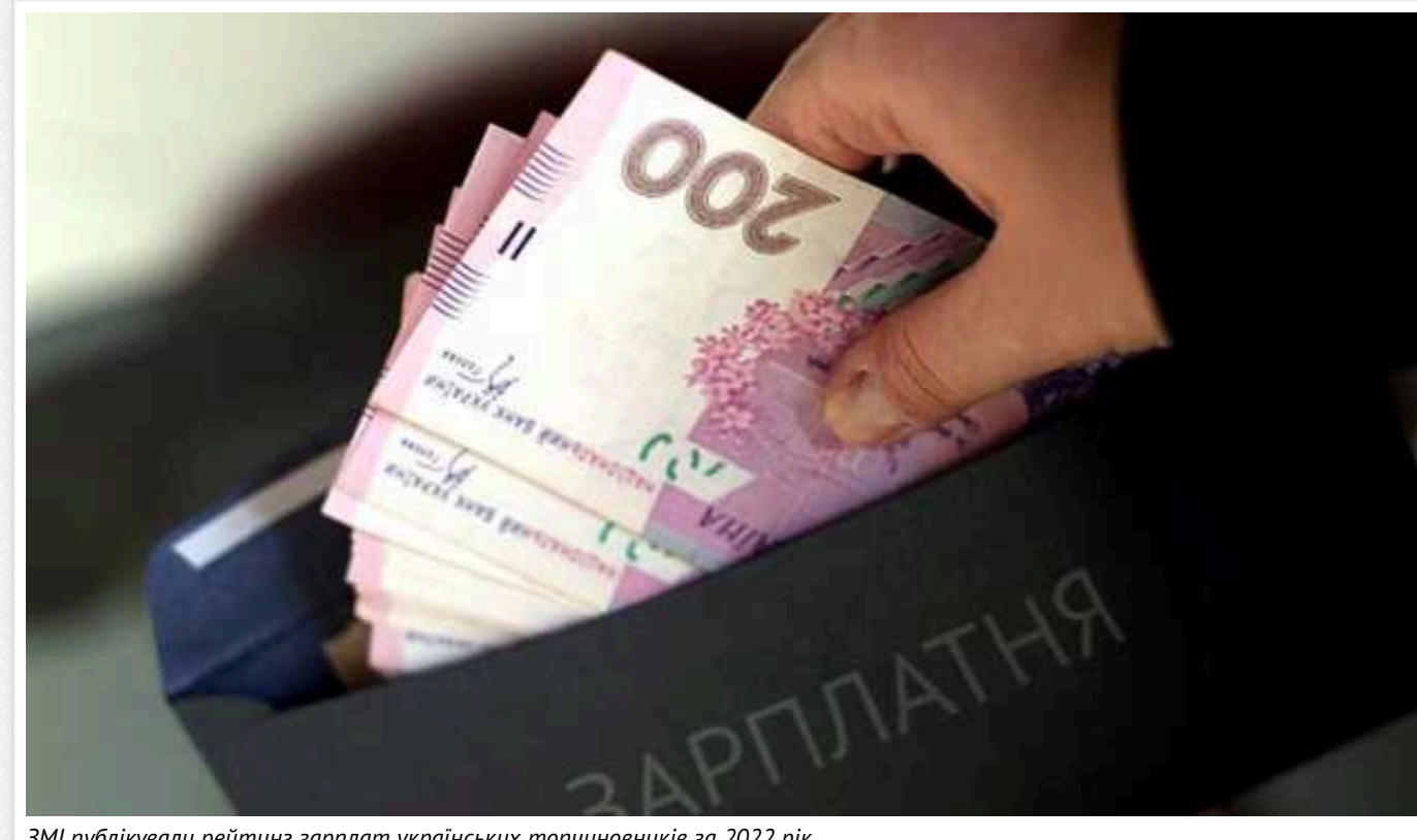
ЗМІ публікували рейтинг зарплат українських топчиновників за 2022 рік

На першому місці - экс-міністр оборони Резніков (1,262 млн грн).