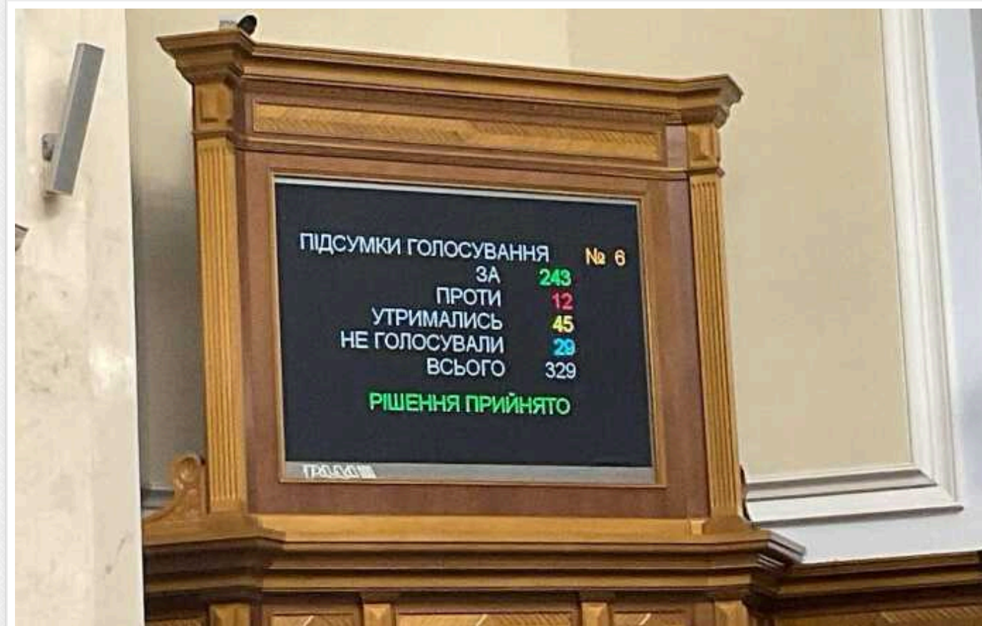
Дві партії в ВР не підтримали законопроект про мобілізацію через "репресивні норми"

Верховна Рада ухвалила в першому читанні скандальний законопроект про мобілізацію. "За" проголосували 243 депутати. Долю документа вирішили фракції "Слуга народу", "Голосу", депутати від колишньої ОПЗЖ, груп "Довіра" та "За майбутнє".