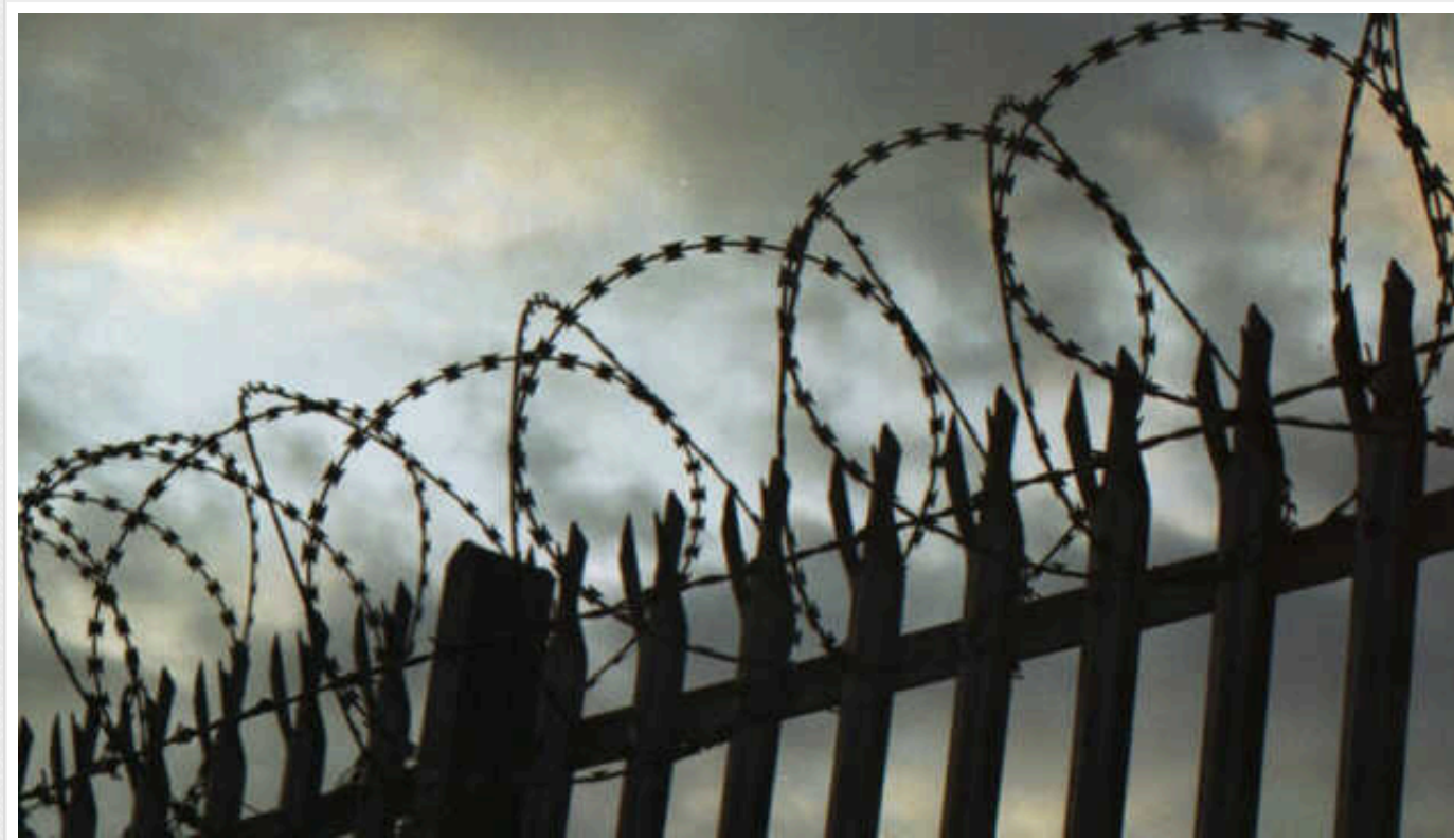
У Канаді глава розвідувальної служби поліції отримав 14 років в'язниці за шпигунство

Колишнього генерального директора Національного координаційного центру розвідувальної служби Королівської канадської кінної поліції Кемерона Ортіса, який передав зловмисникам таємну інформацію, засудили до 14 років позбавлення волі.