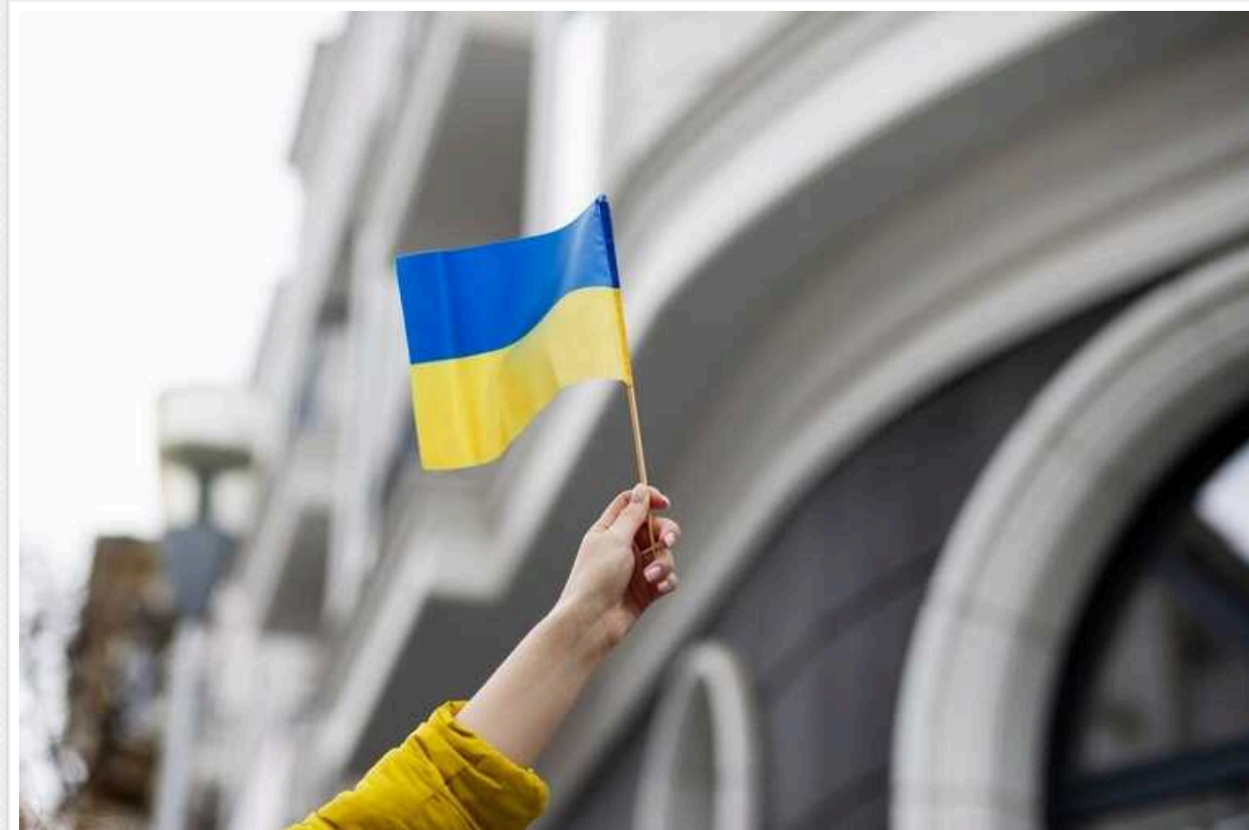
41% українців вважають, що країна рухається у правильному напрямку, - опитування

Кількість українців, які вважають, що країна рухається у правильному напрямку, знизилася до 41%, майже зрівнявшись із кількістю тих, хто дотримується зворотної думки (38%).