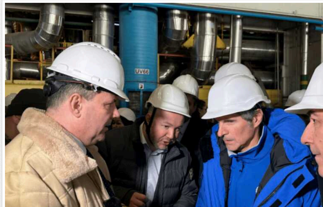
Гендиректор МАГАТЕ прокоментував свій візит до ЗАЕС: "Немає місця для самозаспокоєння"

Рафаель Гроссі вчетверте приїхав на захоплену росіянами Запорізьку атомну електростанцію в Энергодарі. Після цього Гроссі попрямує на переговори до Москви.