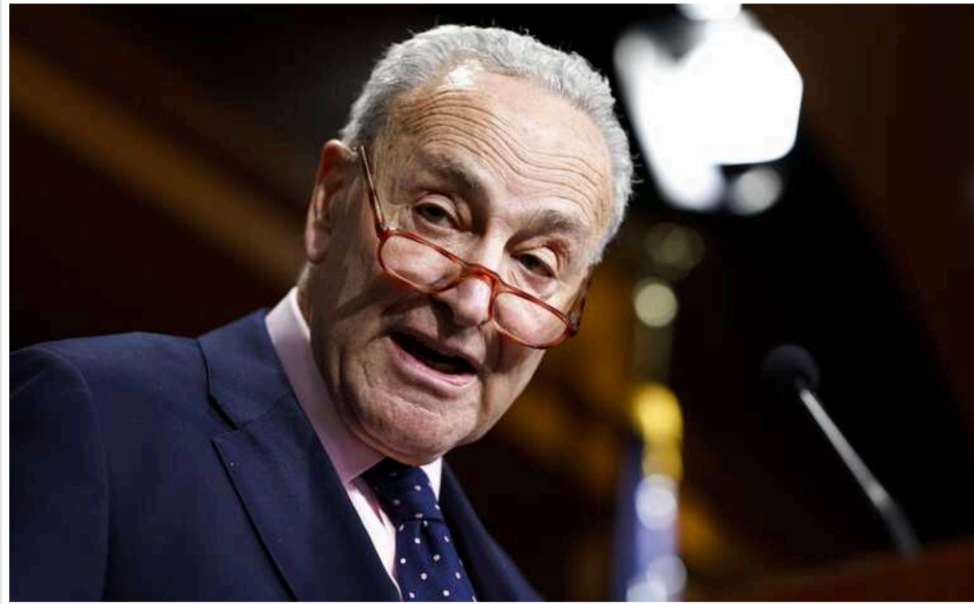
Чак Шумер планує винести на голосування законопроект про фінансування України, Ізраїлю та Тайваню - без південного кордону США

Про це повідомляє The Hill із посиланням на джерела.