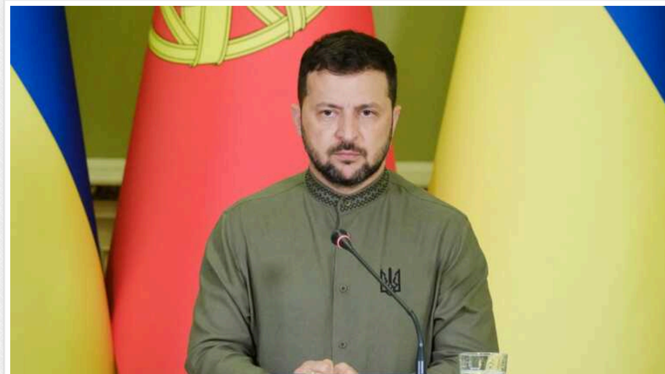
Майже 70% українців продовжують довіряти Зеленському, – опитування

Опитування проводилося з 19 до 25 січня 2024 року.