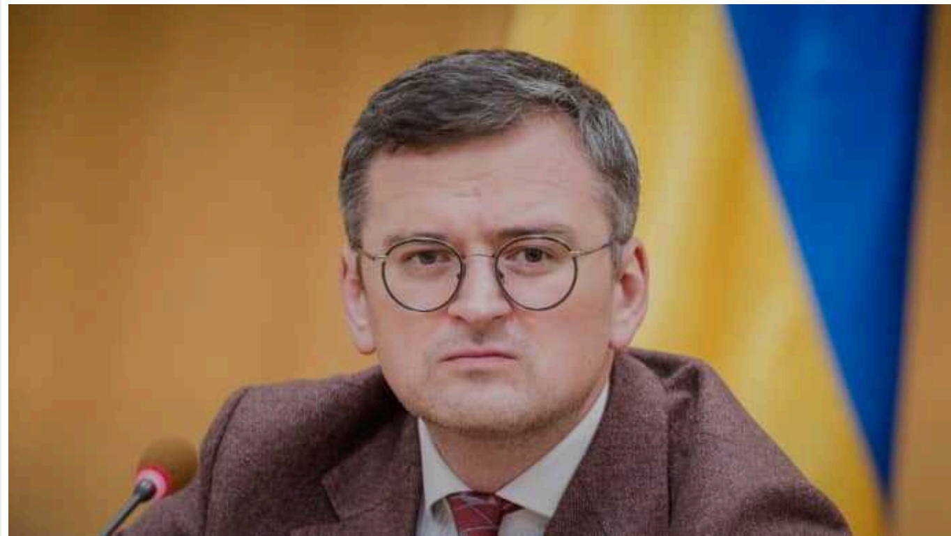
Кулеба розповів, як можна вирівняти артилерійський баланс снарядів з РФ: "Потрібні екстраординарні заходи"

Артилерійський баланс наявності снарядів в українській армії з арсеналом боєприпасів ворога, який РФ застосовує проти України, можна вирівняти. Але для цього потрібно докласти комплексних зусиль.