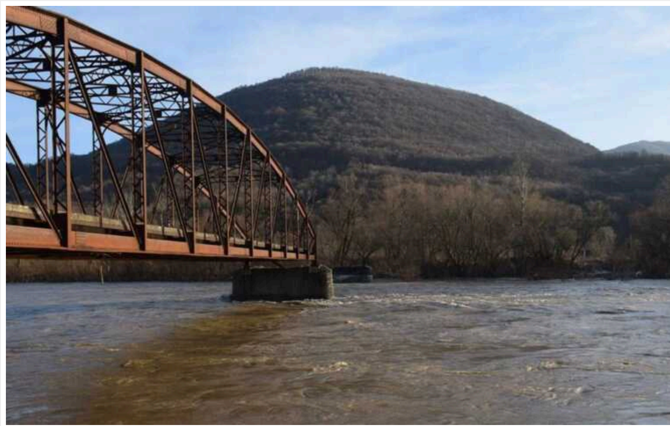
Румунські прикордонники виловили тіло українця, який намагався переплисти Тису

Чоловік намагався переплисти через Тису до Румунії і загинув через сильну течію.