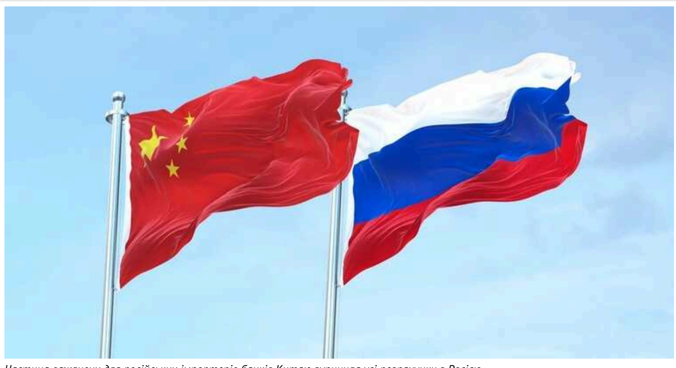
Частина важливих для російських імпортерів банків Китаю зупинила усі розрахунки з Росією

Китайський банк Zhejiang Chouzhou Commercial Bank повідомив клієнтів про зупинення операцій із країною-терористкою Росією. Проте це не єдина фінустанова, яка пішла на це.