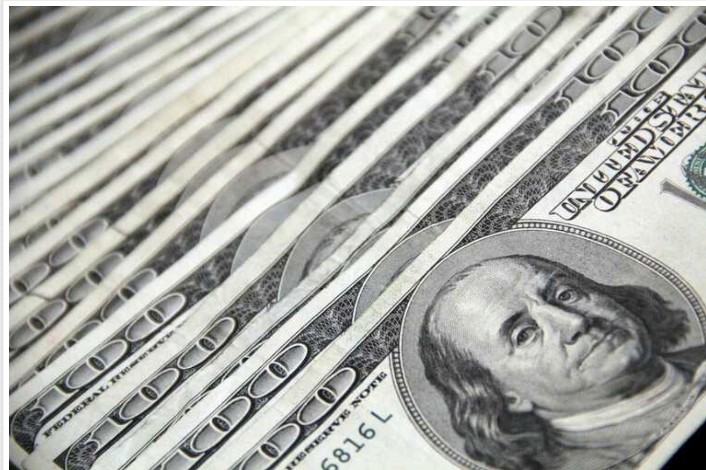
Китайський фінансист переказав шахрям 25 мільйонів доларів: спілкувався з дипфейком "керівництва"

У середині січня шахраї за допомогою дипфейків змусили фінансиста гонконгської філії транснаціональної компанії перевести їм із корпоративного рахунку понад 25 мільйонів доларів.