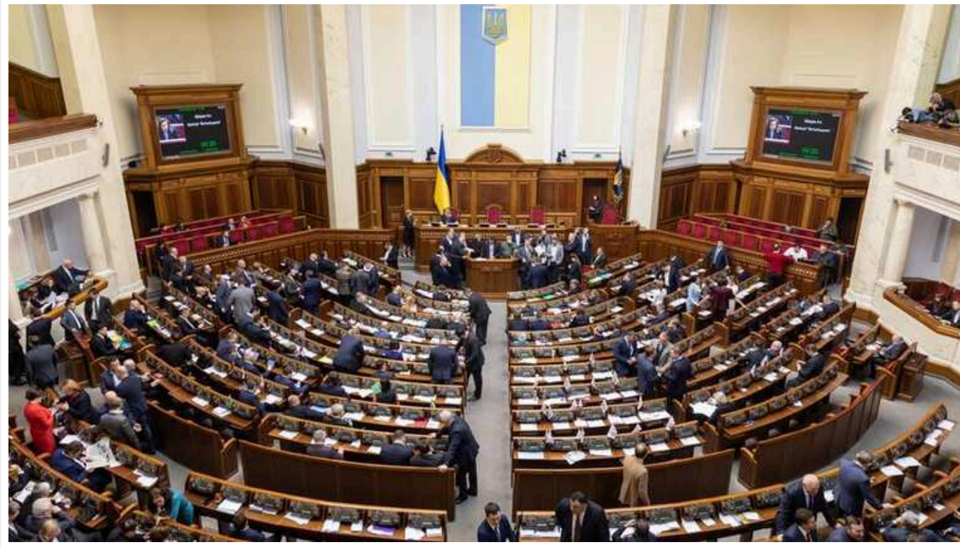
ВР планує скасувати відстрочку для аспірантів-контрактників: останні вважають норму дискримінаційною

Верховна Рада у першому читанні підтримала законопроект №10449 про посилення мобілізації. У ньому пропонується позбавити права на відстрочку аспірантів, які здобувають освіту за кошти фізичних або юридичних осіб – тобто навчаються на контракті.