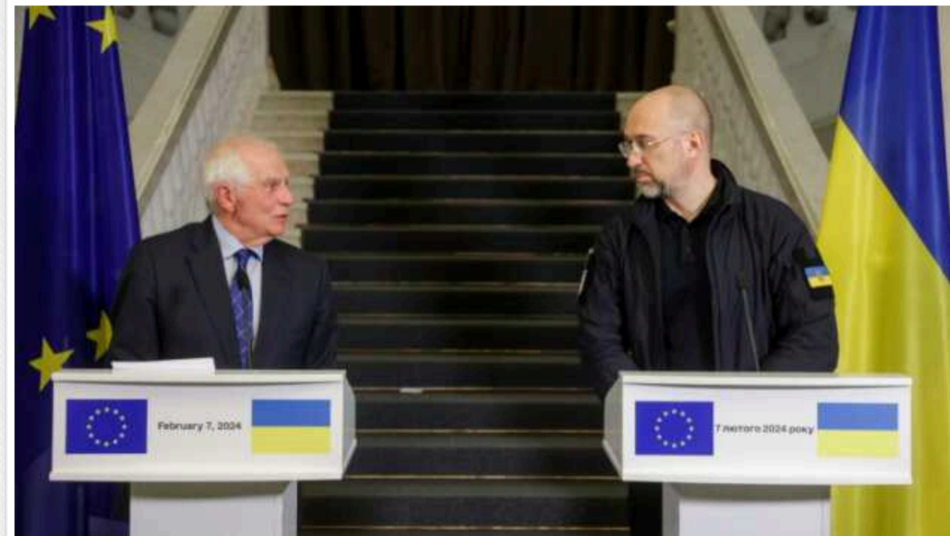
Єдність політиків та суспільства - ключова для перемоги України у війні, - Боррель

Політичні розбіжності є ознакою демократії, але єдність політиків і суспільства є ключовою для перемоги України у війні.