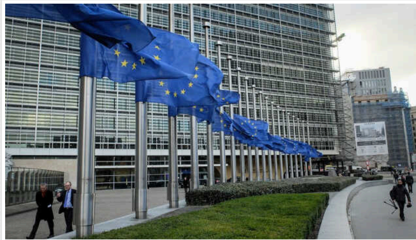
Єврокомісія порушила ще одну правову процедуру проти Угорщини

Єврокомісія порушила ще одну правову процедуру проти Угорщини у зв'язку із прийняттям нових законів, що порушують законодавство ЄС, зокрема, у сфері верховенства права, дотримання фундаментальних свобод та норм демократії.