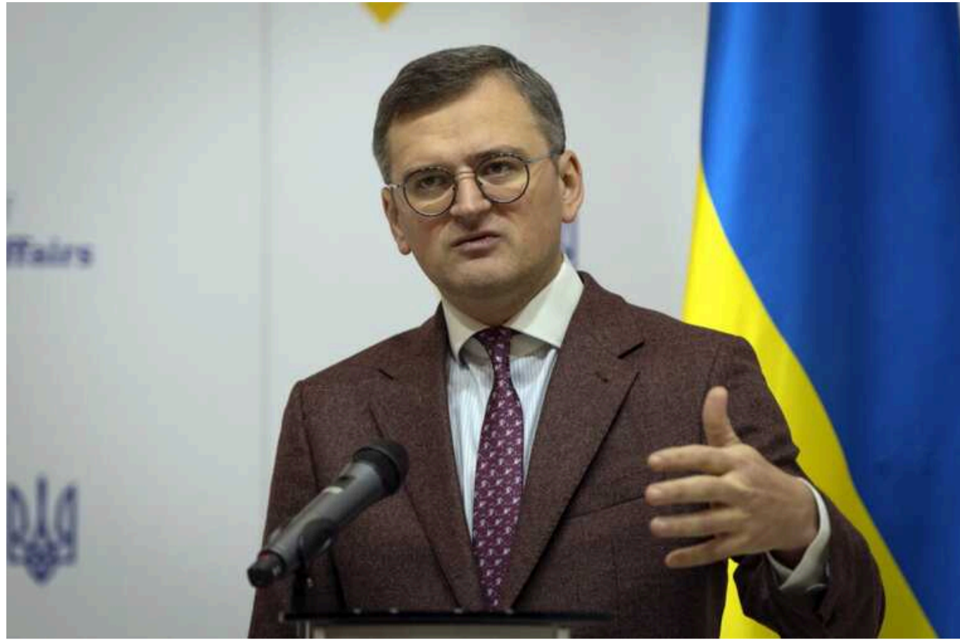
Потрібно розпочати переговори з третіми країнами, - Кулеба про постачання снарядів від Євросоюзу

Для того, що Збройні сили отримали більше боеприпасів від Європейського союзу, Україні потрібно паралельно розпочати переговори з третіми країнами, які законтрактували снаряди в Європі.