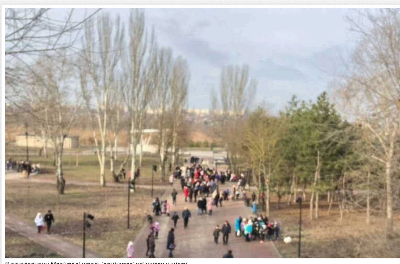
В окупованому Маріуполі хтось "замінував" усі школи у місті

За інформацією ТГ-каналу "Маріуполь. Зараз", батьки у чатах повідомляють про мінування всіх шкіл окупованого Маріуполя.