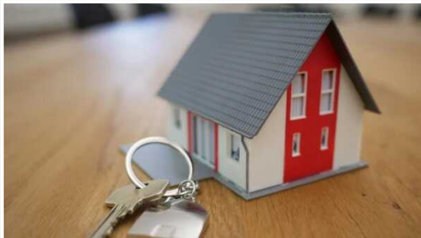
В Україні бум іпотеки для сімей без дітей

Під час війни змінився портрет типового іпотечного позичальника – за кредитами дедалі частіше звертаються молоді сім'ї без дітей. До війни ситуація була протилежною.