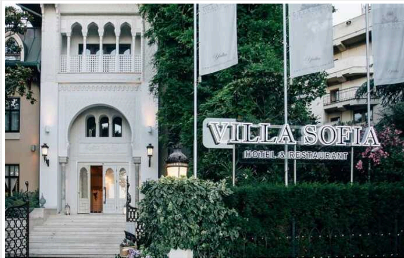
В окупованому Криму окупанти планують перетворити віллу Ротару на РАЦС

В анексованому Криму росіяни пропонують "націоналізувати" віллу української співачки Софії Ротару та зробити з неї Палац урочистих подій.