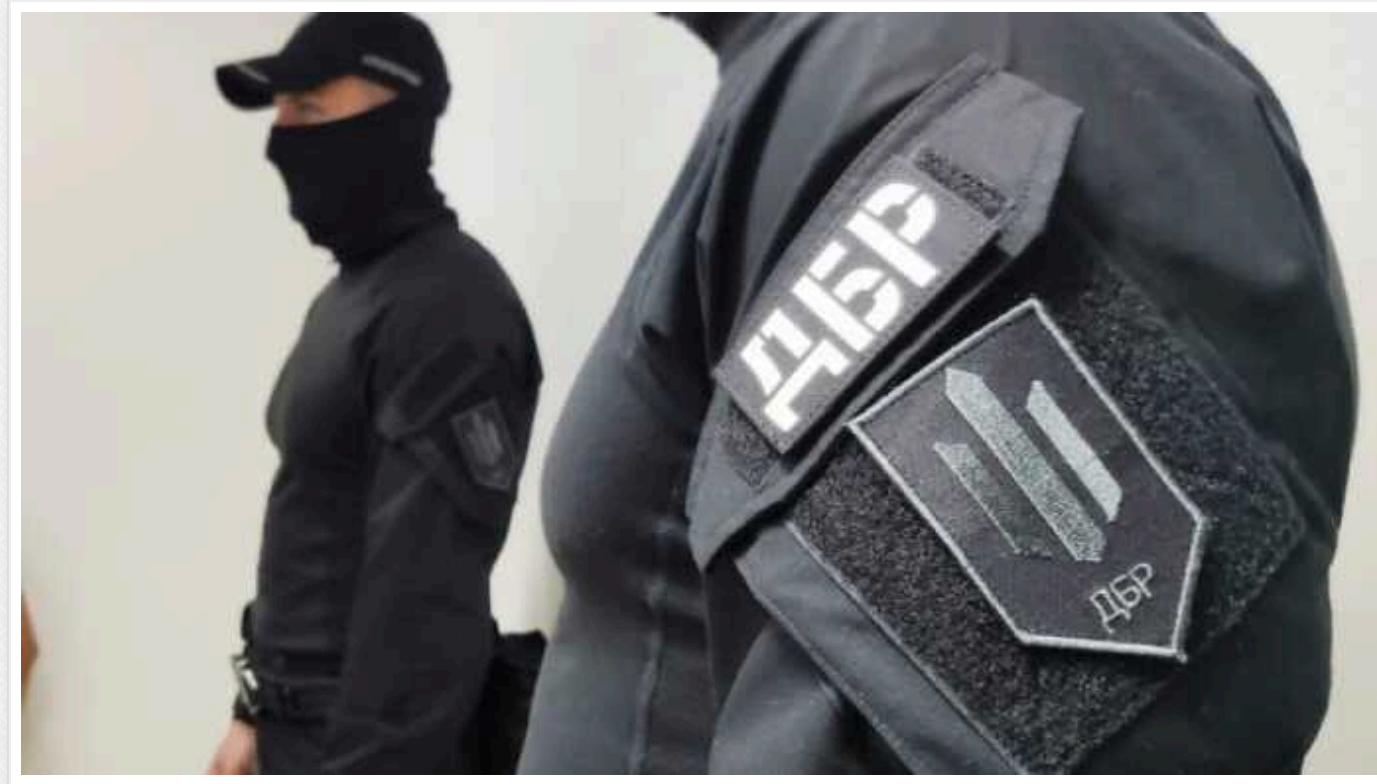
На Одещині співробітник військкомату та правоохоронець торгували «білими квитками»

На Одещині ДБР затримало співробітника військкомату та правоохоронця, які торгували «білими квитками». Про це повідомляє бюро.