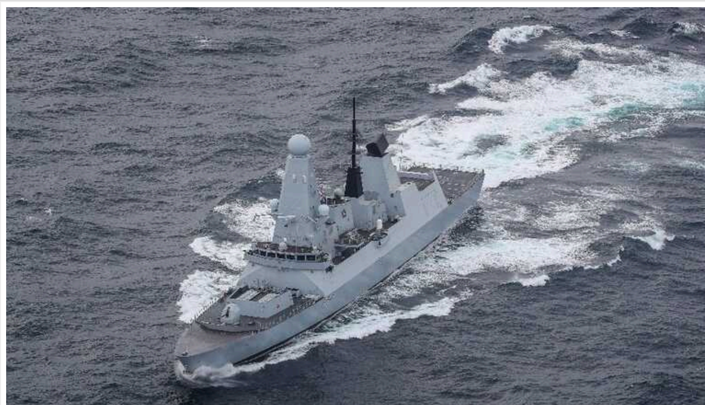
Ротація у Червоному морі: Велика Британія проведе заміну свого фрегата HMS Diamond

Корабель замінить фрегат HMS Richmond, який озброєний, зокрема, ракетними комплексами Sea Ceptor. Озброєння здатне захистити кораблі, що розкидані по території в 500 квадратних миль.