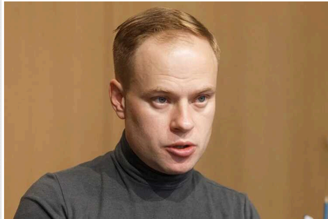
У Верховній Раді закликали створити слідчу комісію: "Ситуація з Bihus.info нагадує вбивство Гонгадзе"

Голова парламентського комітету з питань свободи слова Ярослав Юрчишин поцікавився у колег чи не здається їм, що в Україні почало "пахнути пізнім кучмізмом". Нардеп закликав Раду взяти атаки на журналістів під власний контроль.