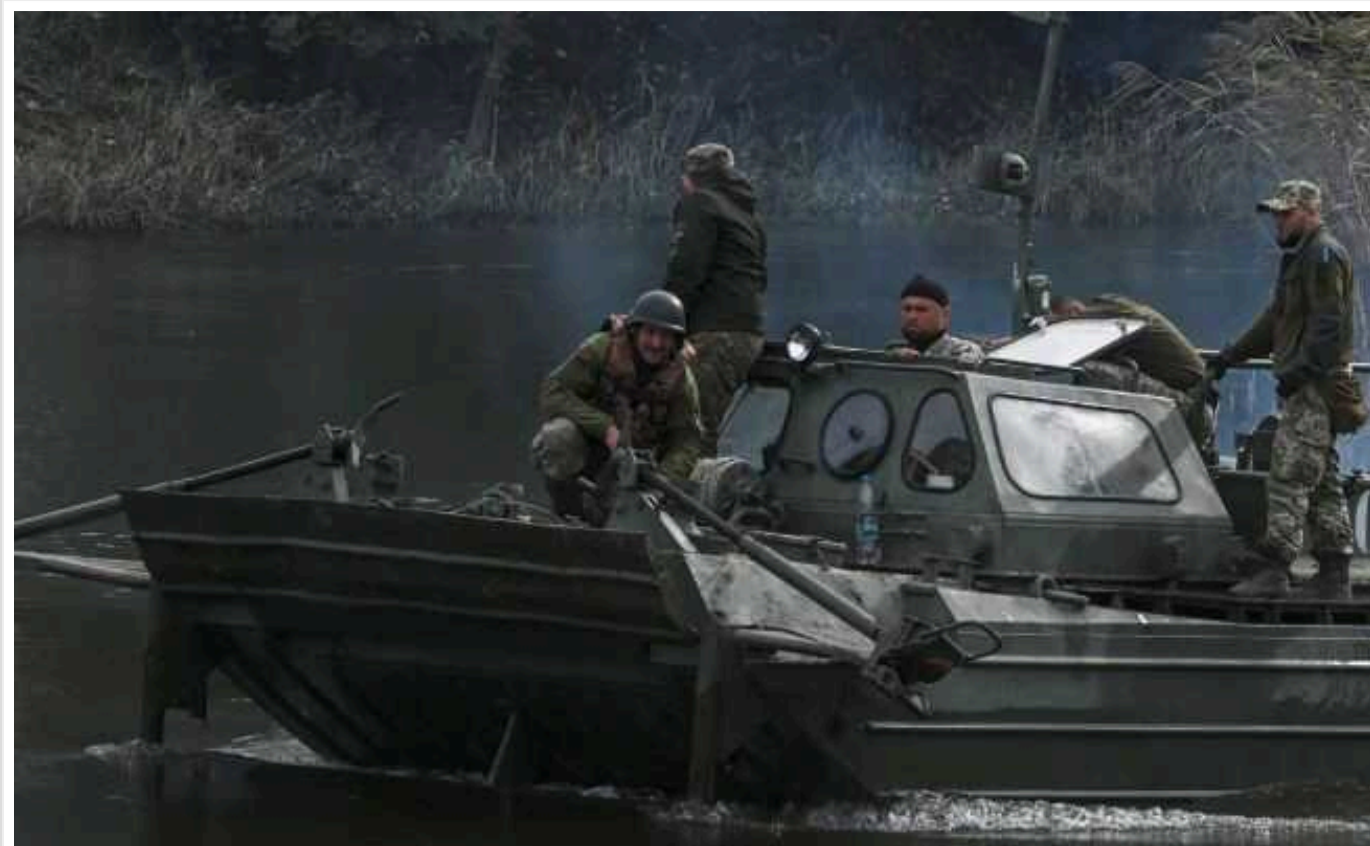
Що робити та як воювати, якщо допомоги США не буде

Для багатьох українців результат контрнаступу 2023-го став неатішим, чи то через його надмірну розрекламованість протягом всього року, що вплинуло на завищені очікування, чи то через втому від війни.