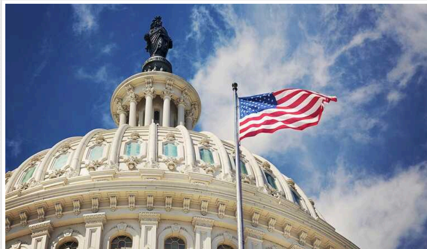
У Сенаті США республіканці хочуть зосередитися на допомозі Україні, Ізраїлю та Тайваню

Республіканці у Сенаті Сполучених Штатів Америки хочуть розглядати допомогу Україні, Ізраїлю та Тайваню вже без прив'язки до захисту кордону з Мексикою.