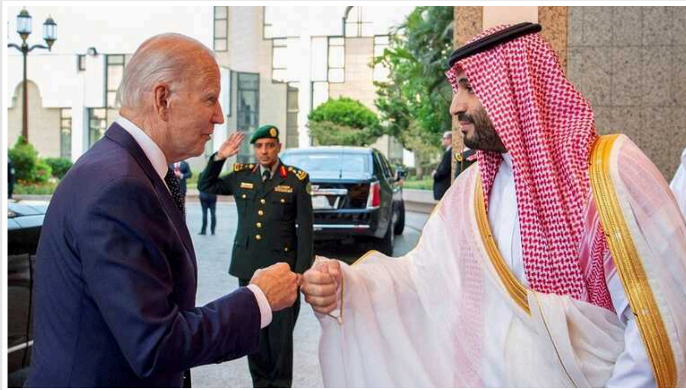
МЗС Саудівської Аравії: Не матимемо дипломатичних відносин з Ізраїлем, доки не буде визнана незалежна Палестинська держава

МЗС Саудівської Аравії заявило, що не піде на бажану США розрядку з Ізраїлем, доки не буде створено державу Палестина.