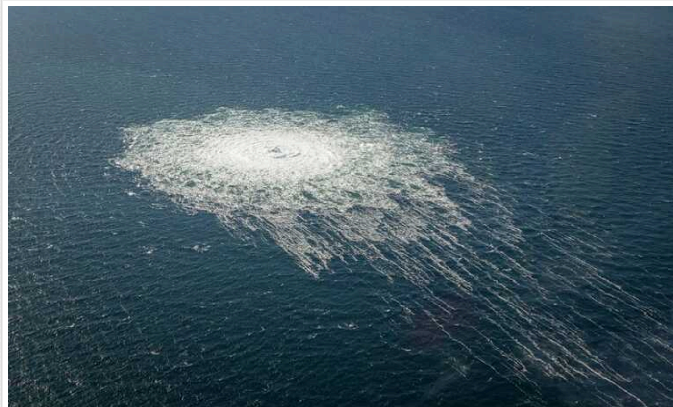
В Швеції прокуратура закрила розслідування диверсій на «Північних потоках»

Місцеві ЗМІ повідомляють, що шведська прокуратура закрила розслідування щодо підризу «Північного потоку» через "відсутність юрисдикції".