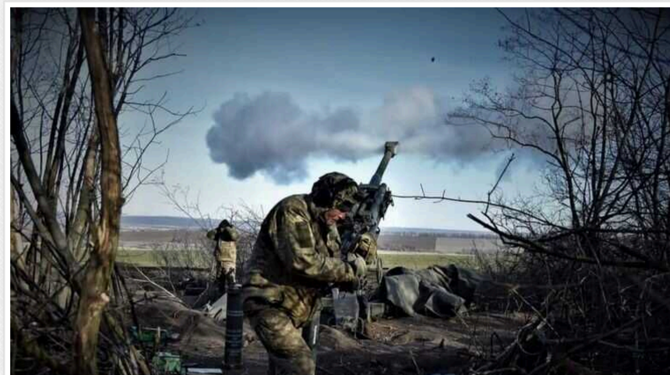
Артилеристи показали ефектну роботу по ворогу: знищено російський броньовик "Тайфун-К" за 2,5 мільйона доларів

Воїни з лав 71 окремої егерської бригади десантно-штурмових військ Збройних сил України знищили російський броневомобіль підвищеної захищеності "Тайфун-К". Він серед ночі привіз на позиції загарбників боеприпаси.