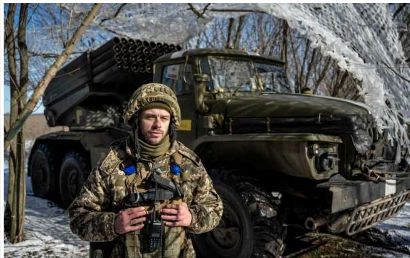
Ситуація на фронті: ворог продовжує штурми на лівобережжі Дніпра і зазнає значних втрат, авіація Сил оборони 13 разів ударила по окупантах

Окупаційні війська РФ продовжують штурми на лівобережжі Дніпра, при цьому зазнають значних втрат. Авіація Збройних сил України здійснила удари по 13 районах, де концентрується ворожий особовий склад, а також по 2 зенітно-ракетних комплексах противника.