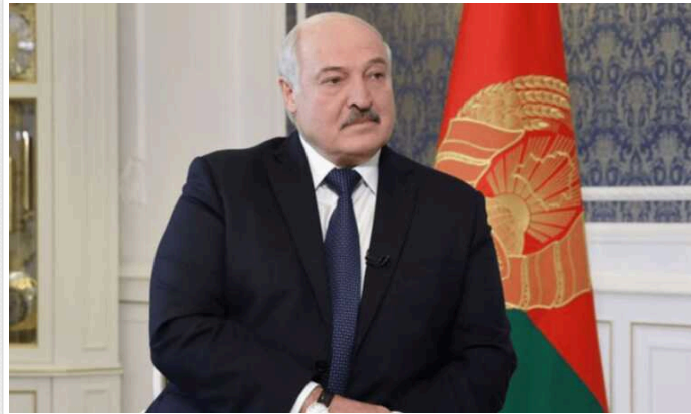
ЗМІ: Лукашенко заробляє мільйони доларів на контрабанді тютюну до Великої Британії