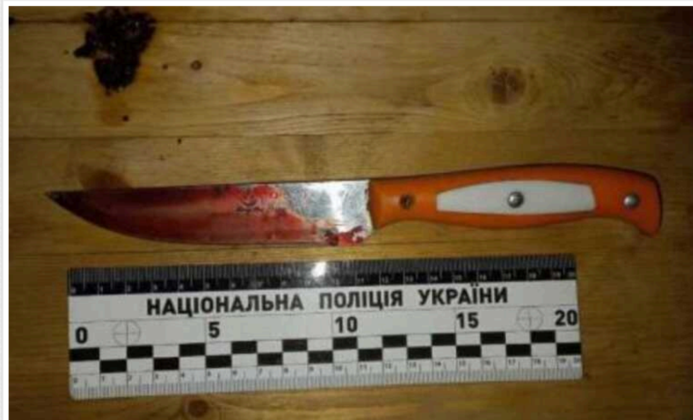
Під час спроби зґвалтування підліток зарізав 71-річну пенсіонерку