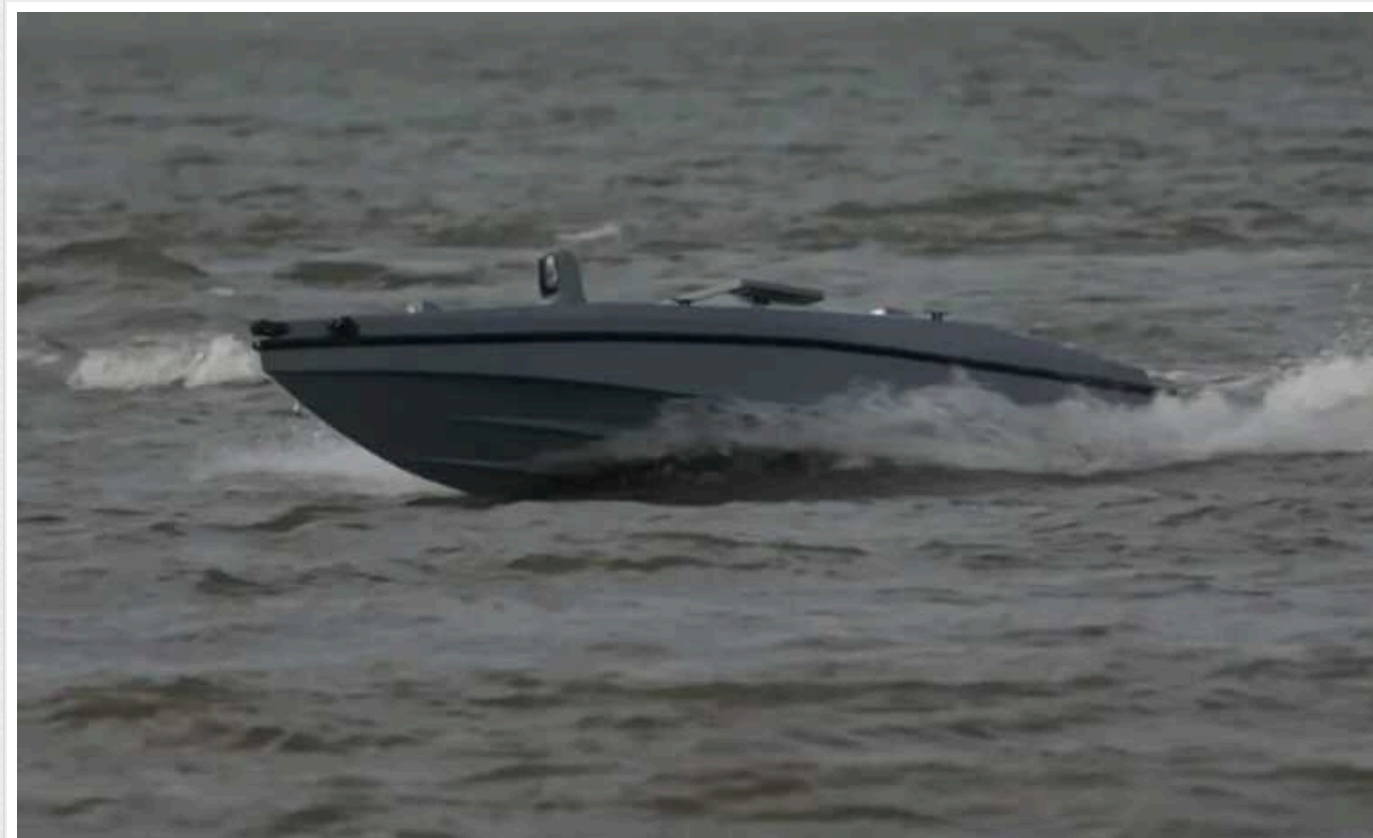
Стали відомі нові деталі ураження катера "Івановець" дронами MAGURA

Нещодавно українські військовослужбовці знищили російський ракетний катер "Івановець". Ворожу ціль відправили на дно Чорного моря за допомогою надводних дронів MAGURA.