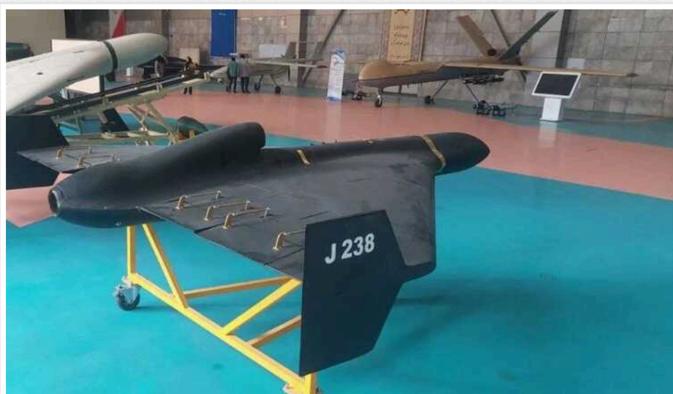
РФ просуває на ринки озброєнь реактивні "Шахеда" як свою розробку

У Росії налагодили виробництво іранських дронів-камікадзе типу Shahed . При цьому модифікацію цих іранських безпілотників з реактивним двигуном окупанти просувають на світовому ринку озброєнь як власну розробку, зокрема, брошури з відповідним змістом помітили на виставці World Defence Show 2024 , що проходить у Саудівській Аравії.