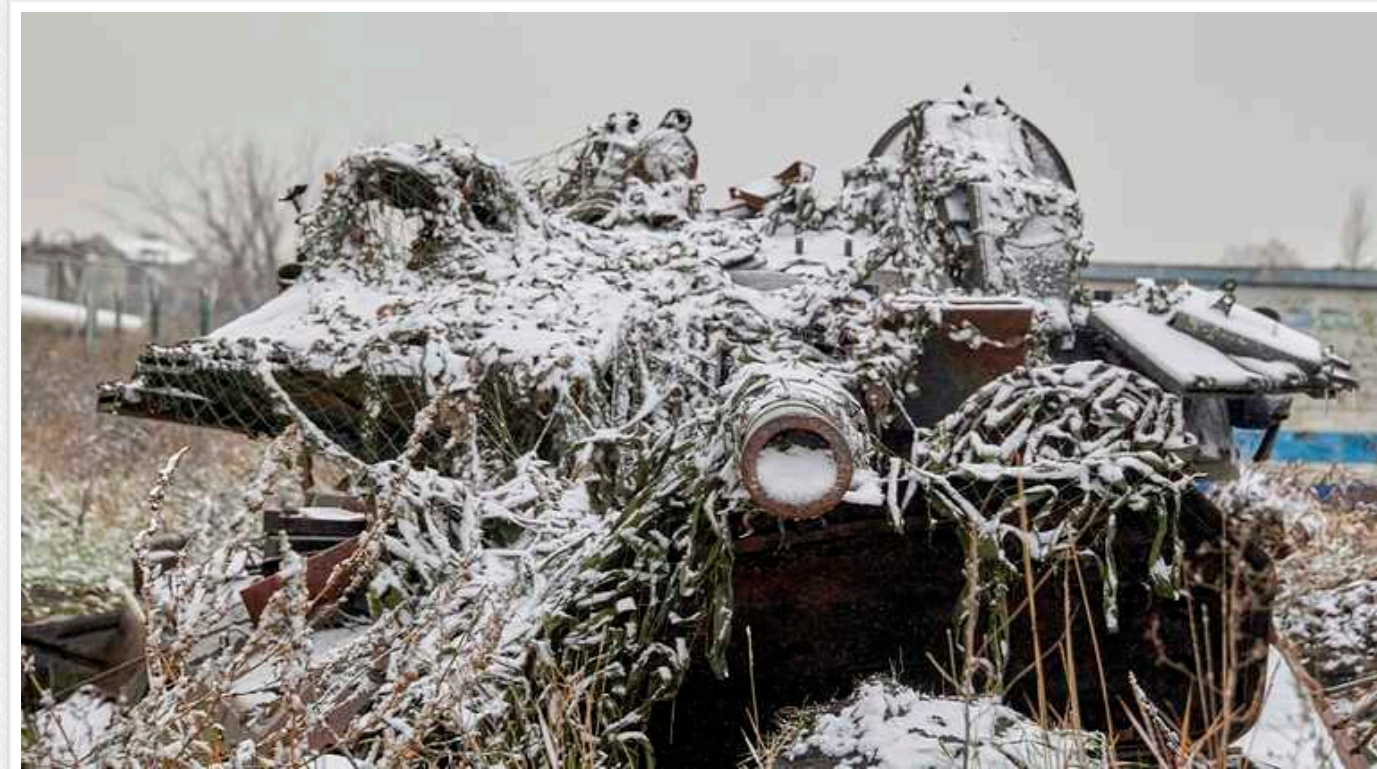
Воїни 128-ї бригади показали нічне полювання на ворога: техніка окупантів знищується просто на ходу

Українські захисники показали, як полюють на ворога ночами. На кадрах видно, як оператори БПЛА 128 окремої гірсько-штурмової Закарпатської бригади скидають "подарунки" окупантам, після чого їхня техніка вибухає просто на ходу.