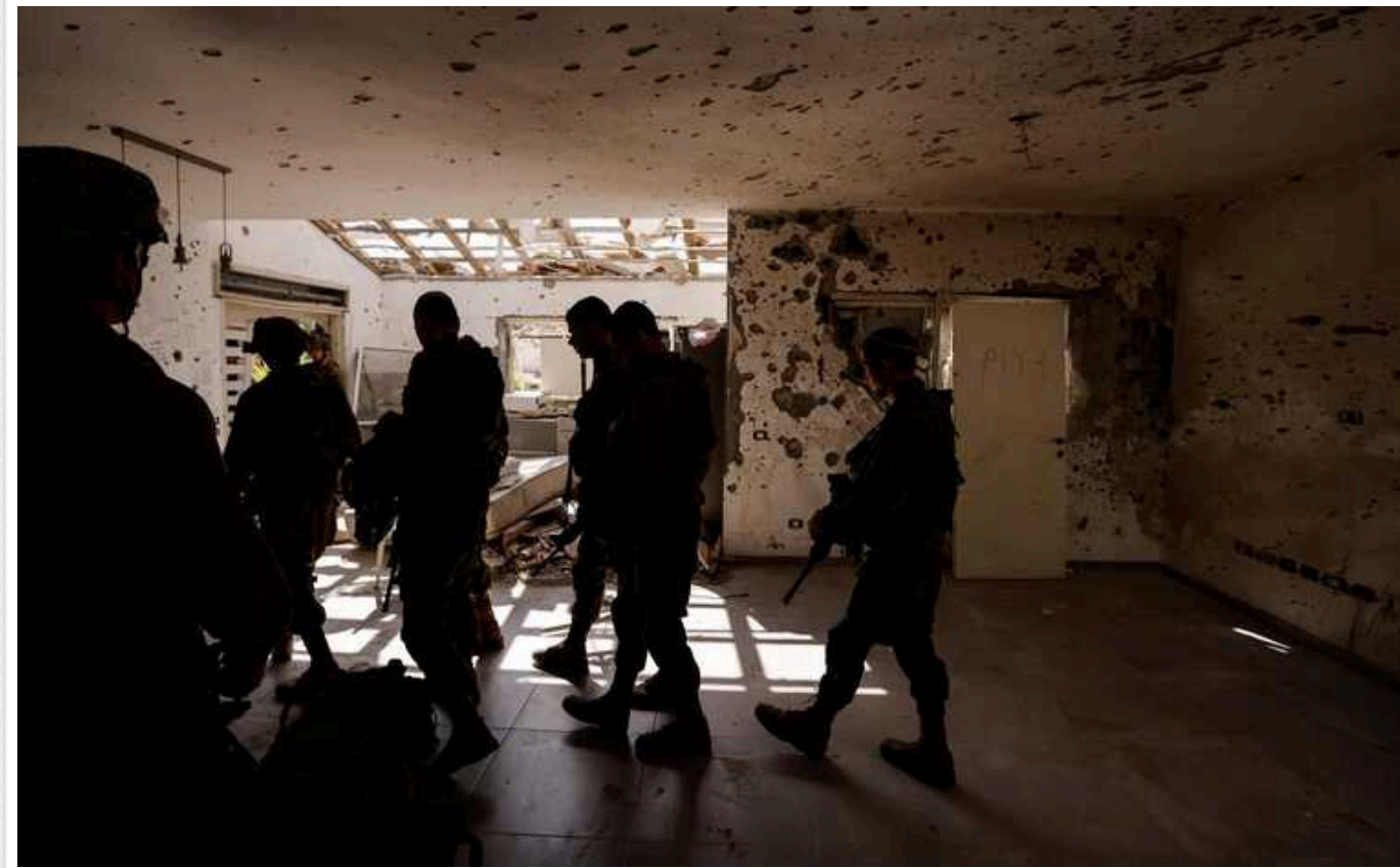
NYT: В ізраїльській розвідці вважають, що понад 20% заручників ХАМАСу вже мертві

Щонайменше 31 заручник, захоплений в Ізраїлі бойовиками ХАМАСу під час розпочатого 7 жовтня 2023 року нападу, загинув. Непідтверджені дані свідчать, що мінімум 20 інших заручників також могли бути вбиті.