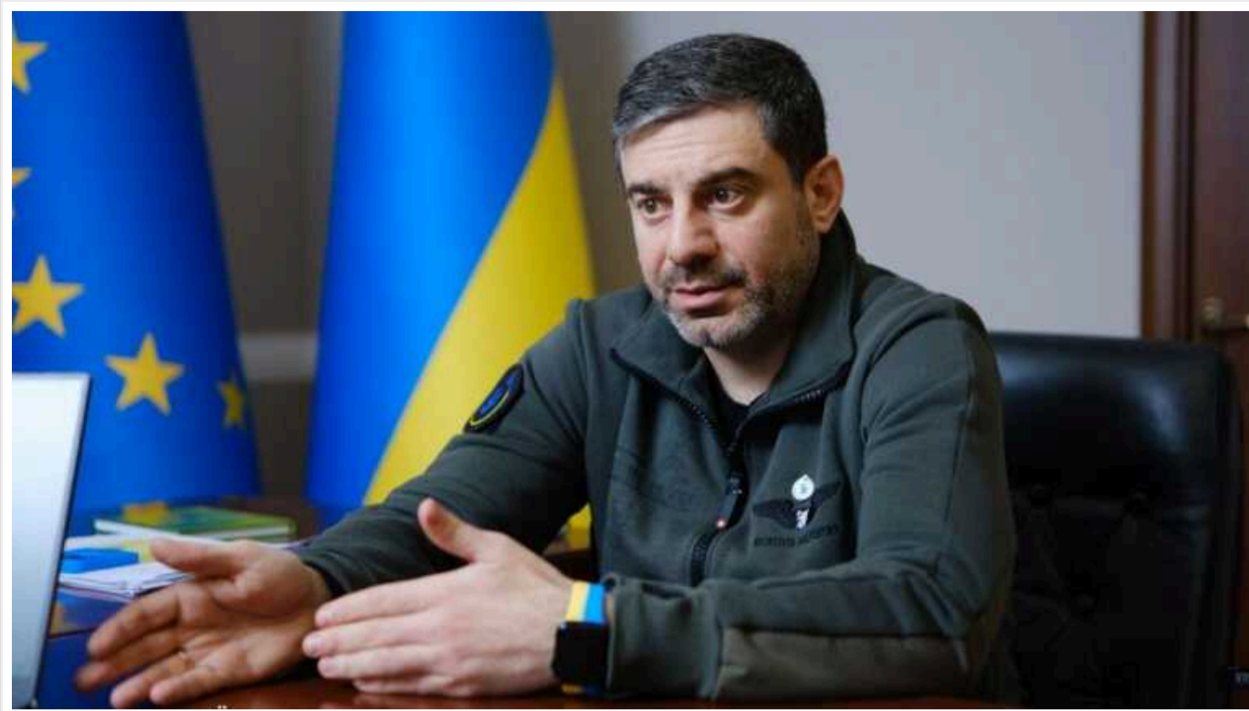
Омбудсмен Лубінець закликає депутатів голосувати за законопроект про мобілізацію, незважаючи на спірність положень

Незважаючи на те, що омбудсмен Дмитро Лубінець раніше заявляв про те, що законопроект щодо мобілізації містить положення, які суперечать Конституції, тепер він закликає депутатів проголосувати за законодавчий акт у першому читанні.