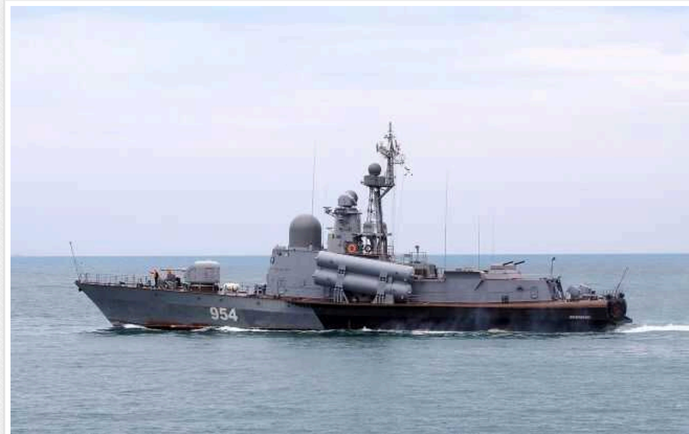
ГУР показало роботу мисливців за російськими кораблями: на рахунку "Івановец" і не лише

Підрозділ Головного управління розвідки Міністерства оборони України Group 13 займається знищенням російських кораблів. Їхню роботу показали на відео.