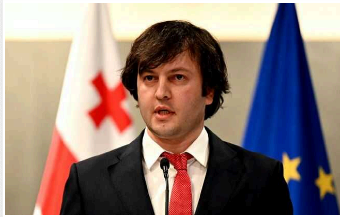
Майбутній прем'єр Грузії оскардилися заявою про Україну: "Хочуть другого фронту"

Майбутній прем'єр-міністр Грузії Іраклій Кобахідзе звинуватив Україну у намірі зробити його країну "новим об'єктом російської агресії".