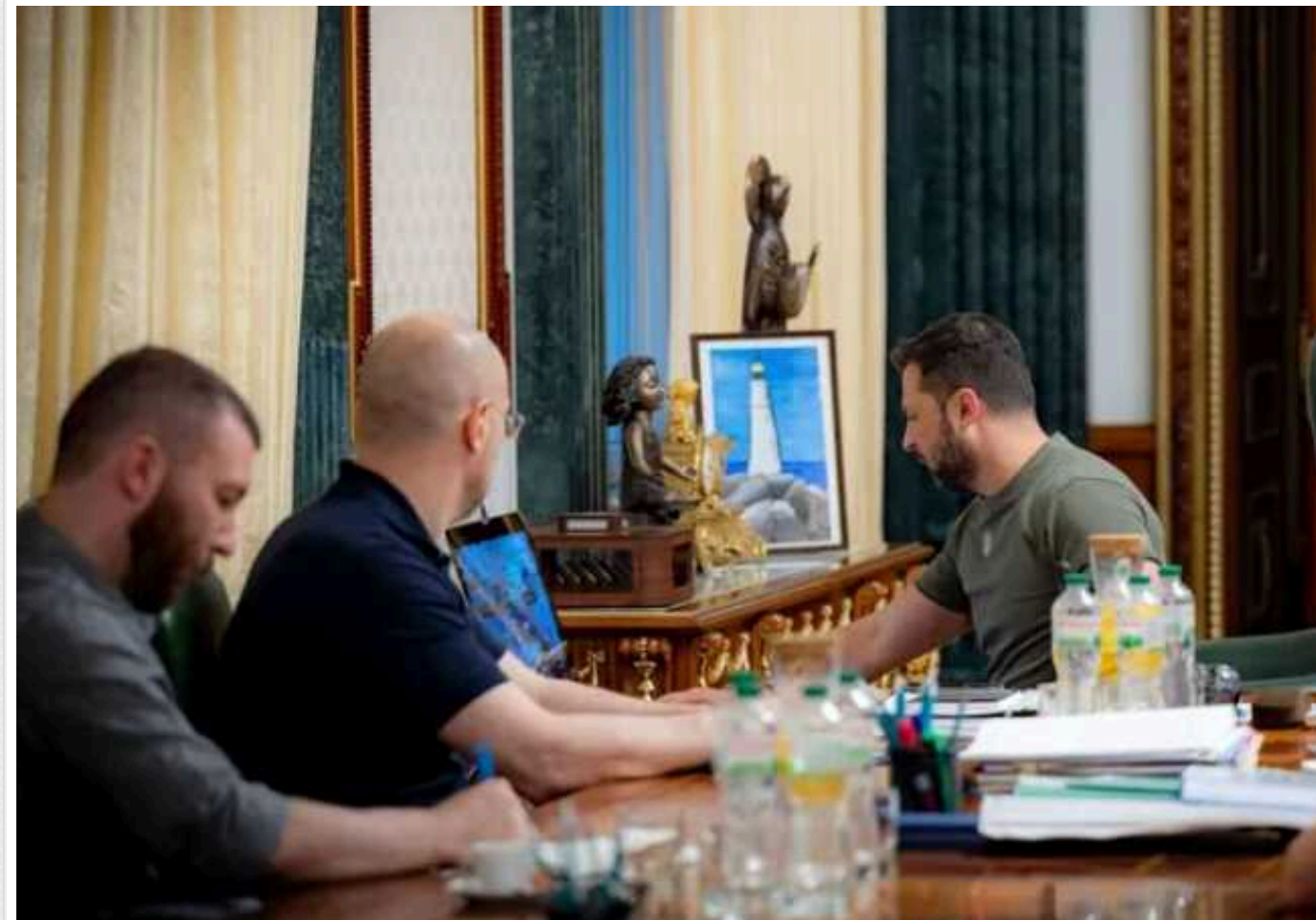
Зеленський пообіцяв нові угоди про гарантії безпеки для України: "Працюємо з кількома країнами"

У вищому керівництві України було проведено нараду щодо нових угод про безпекові гарантії для України. Влада в цьому напрямі працює зараз "із кількома країнами".