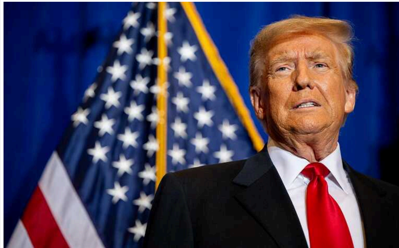
Washington Post: Республіканці бояться стати мішенями "відплати" Трампа, якщо не підтримають його

Багато американських політиків-республіканців бояться викликати невдоволення скандального експрезидента США Дональда Трампа. Вони побоюються, що стануть мішенями "кампанії відплати", якщо мільярдер виграє вибори 2024 року.