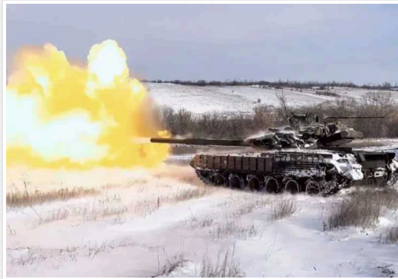
У ЗСУ показали, як витискають максимум з наявної техніки: справжній потенціал розкривається в умілих руках екіпажу

Бійці 56-ї окремої мотопіхотної Маріупольської бригади Збройних сил України показали, як витискають максимум з наявної військової техніки. За словами захисників, навіть бронемашини "у віці" не підводять, якщо опиняються в умілих руках.