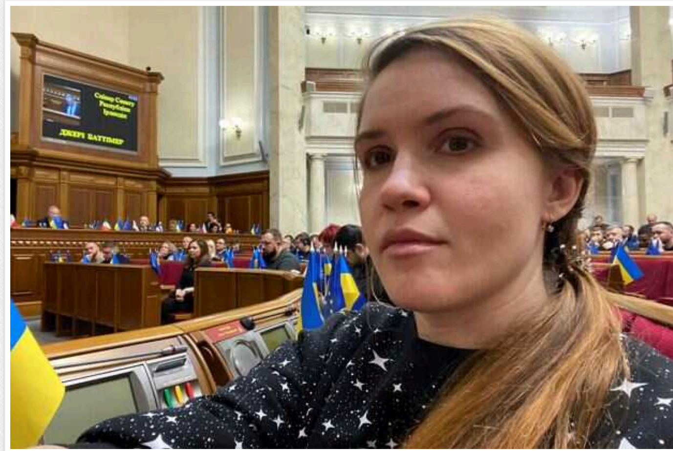
Мар'яну Безуглу виключили з партії "Слуга народу": вона може піти з фракції

Народну депутатку України Мар'яну Безуглу виключили з партії "Слуга народу".