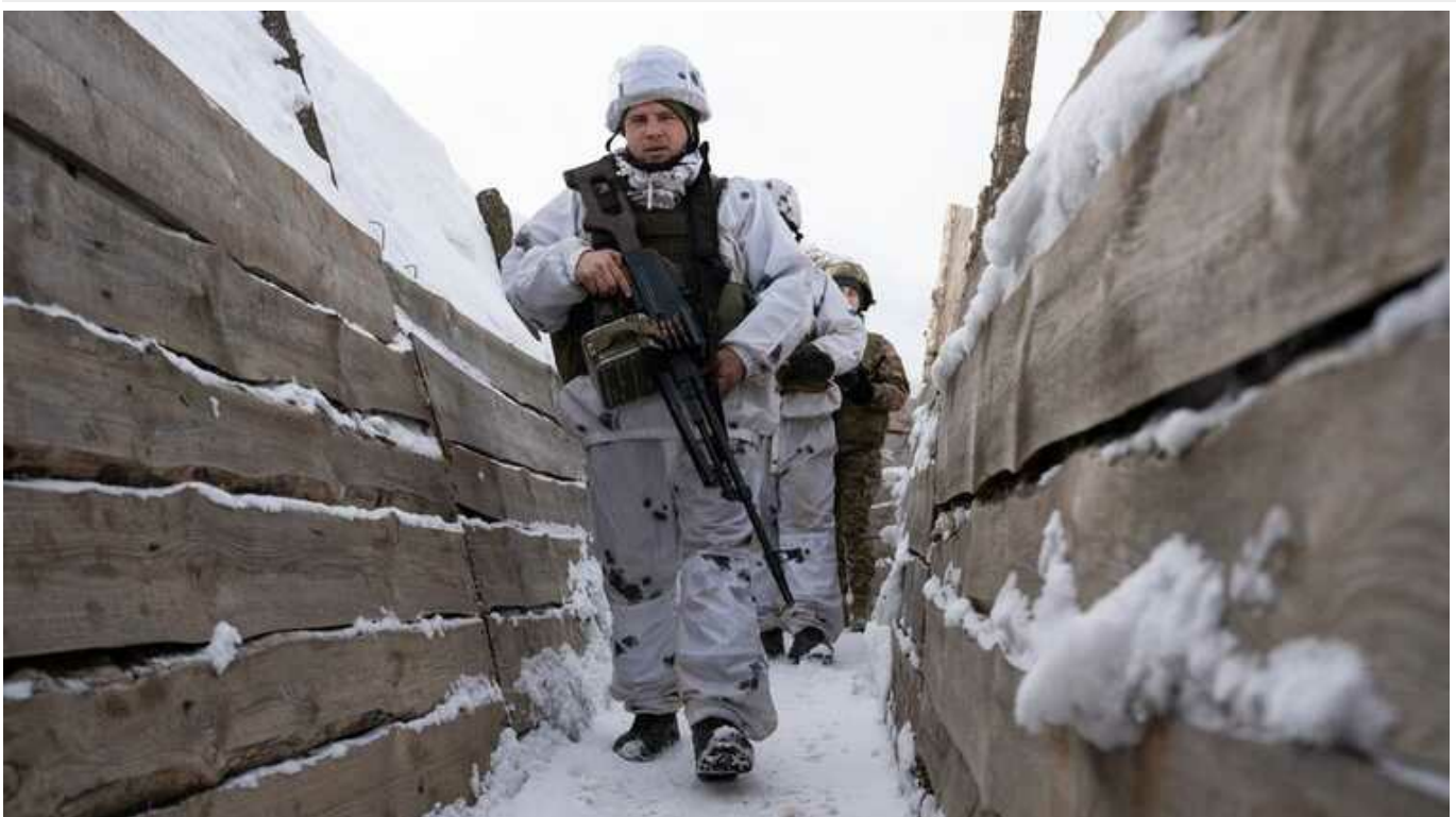
NYT: ЗСУ прагнуть завдати ЗС РФ максимальної шкоди, уникаючи при цьому затяжних боїв

Російські загарбники продовжують штурмувати позиції Сил оборони України, ворог проводить атаки хвилями і не зупиняється. У таких умовах наші військові роблять усе можливе, щоб утримати зайняті ними рубежі та завдати противнику якомога більшої шкоди, не вступаючи при цьому в затяжні бої.