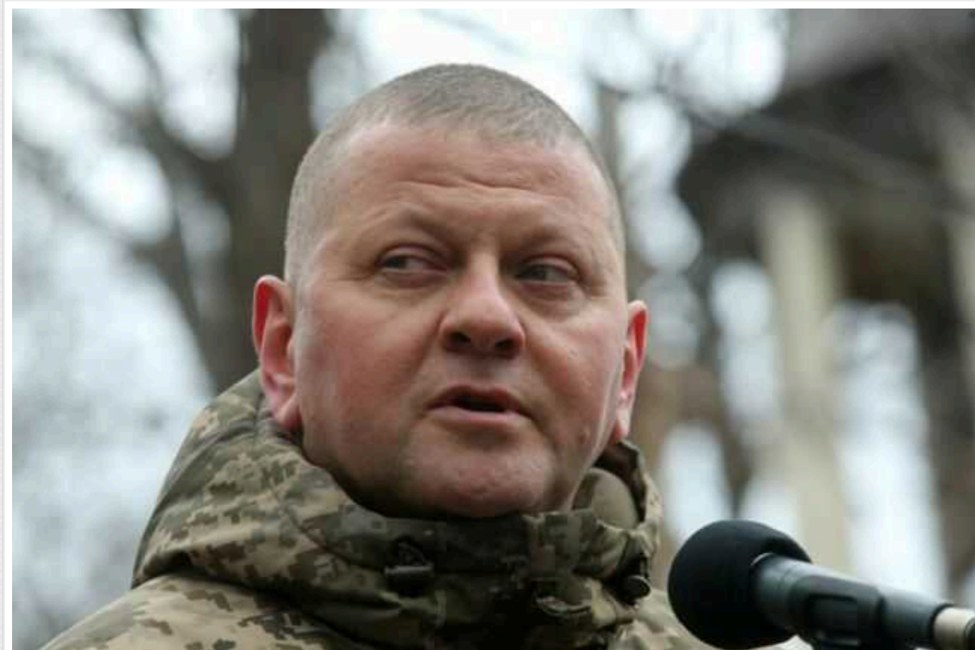
Financial Times: Західні союзники України занепокоєні ймовірним звільненням Залужного

На Заході стурбовані можливою відставкою Валерія Залужного з посади головнокомандувача Збройних сил України. Союзники нашої держави переконані, що якщо президент України Володимир Зеленський все-таки ухвалить таке рішення, то воно може мати "зворотний ефект".