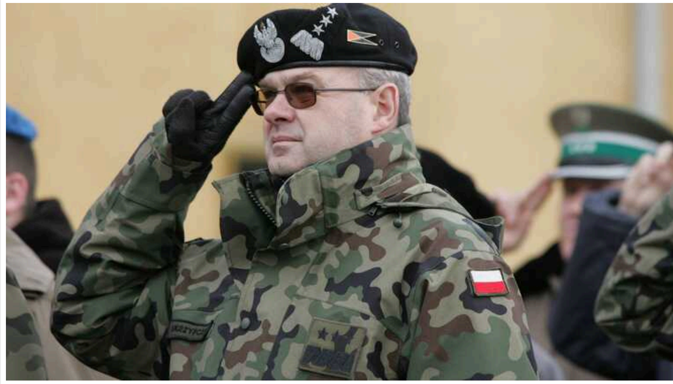
Польський ексгенерал запропонував депортувати з країни українців призовного віку

МЗС Польщі наголошує, що усвідомлює проблему, яку створюють українські біженці чоловічої статі призовного віку.