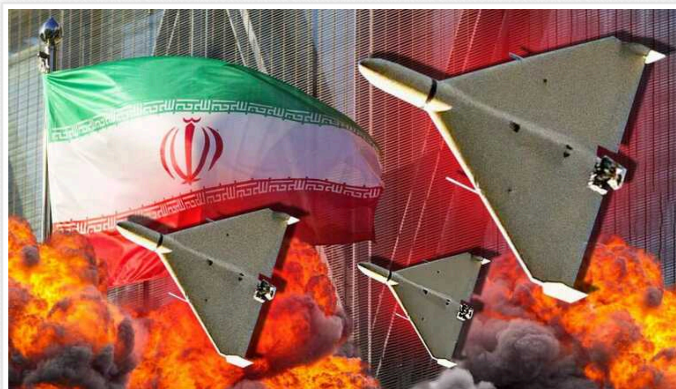
Стало відомо скільки коштує "Shahed-136" для РФ