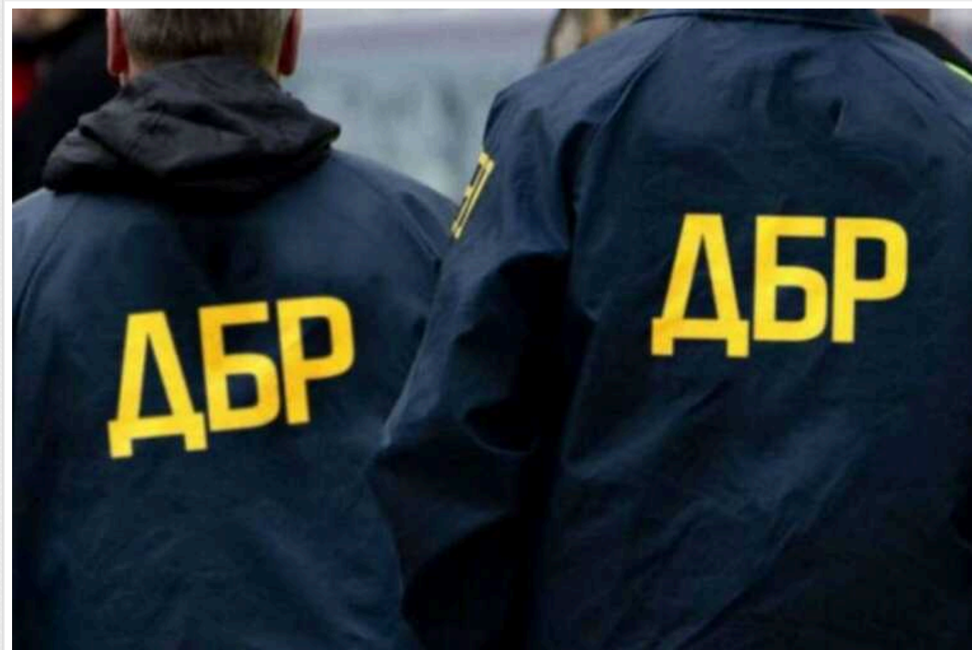
ДБР доручили розслідувати справу про стеження за журналістами Bihus.Info

Офіс генерального прокурора України (ОГПУ) доручив розслідувати справу про стеження за журналістами Bihus.Info співробітникам Державного бюро розслідувань.